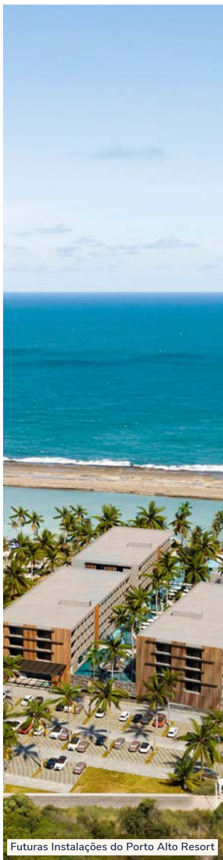
Futuras Instalações do Porto Alto Resort