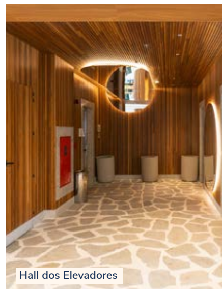
Hall dos Elevadores

Para a designer de interiores, a intenção é que o empreendimento garanta vários momentos únicos e inesquecíveis.