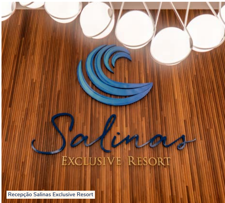
Recepção Salinas Exclusive Resort

A recepção do Salinas Exclusive é o ambiente que mais destaca o estilo de trabalho da designer de interiores, com um mobiliário geométrico de personalidade, contrastado com a iluminação marcante e bem definida nos painéis que revestem as paredes; grandes portas e janelas, permitindo uma intensa luz natural ao longo de todo o dia; e formas com traços simples.